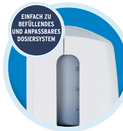
EINFACH ZU BEFÜLLENDES UND ANPASSBARES DOSIERSYSTEM

Der energieeffiziente berührungslose Nexa Dosierspender hält 44 % länger , bevor ein Batteriewechsel erforderlich ist*