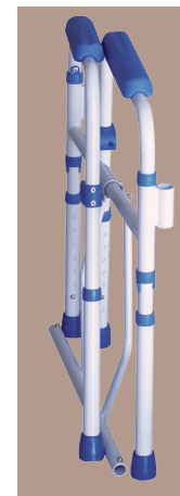
Leicht zu falten