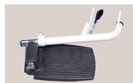
Faltbare und abnehmbare Fußstützen