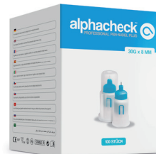
alphacheck professional Pen-Nadel Plus 30G x 8 mm

Art.Nr. 11207005 PZN 12503031 HIMI 03.99.99.1001