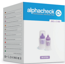
alphacheck professional Pen-Nadel Plus 30G x 5 mm

Art.Nr. 11207005 PZN 12503031 HIMI 03.99.99.1001