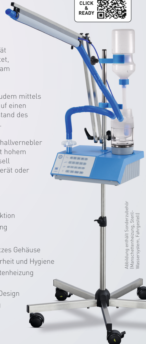
Abbildung enthält Sonderzubehör (Manschettenheizung, Steril- Wassersystem, Fahrgestell)