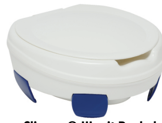
Clipper® III mit Deckel